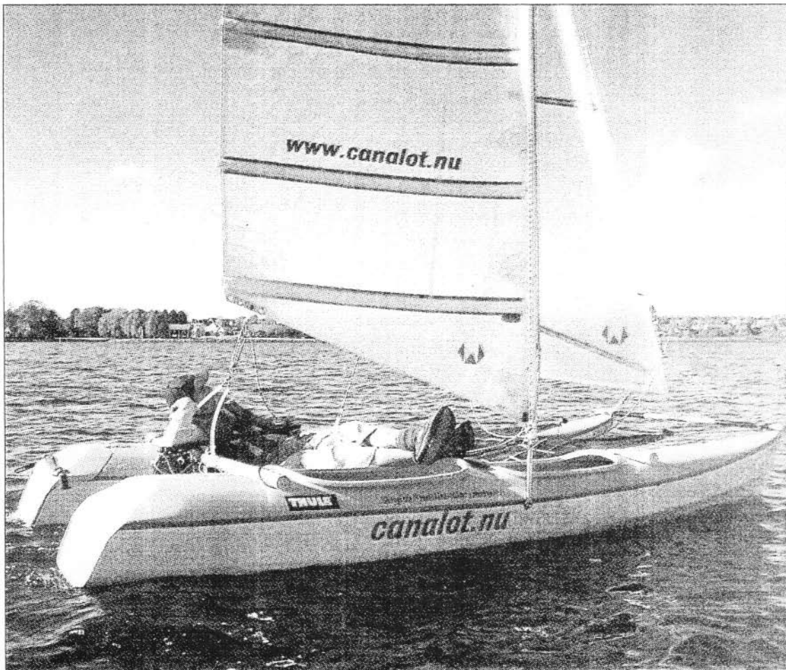
Canalot är en farkost som är både kanot och katamaran, med eller utan segel.

Tillverkningen är numera förberedd till företaget Composittek-